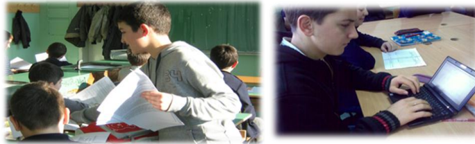
Дали се чувствуваш безбедно во училиштето, а доколку одговорот е НЕ, зошто е тоа така?

Еден од начините за изнесување на мислењето се и анкети за конкретни прашања.