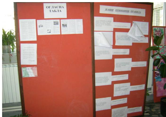
Огласна табла на Ученичката заедница во ОУ „Малина Поп-Иванова“, Кочани

Партиципацијата на учениците претставува една од суштинските компоненти на проектот „Училиште по мерка на детето“. Партиципацијата започнува со информирањето на учениците за сè што се случува во училиштето. Најдобар начин на информирање се огласните табли.