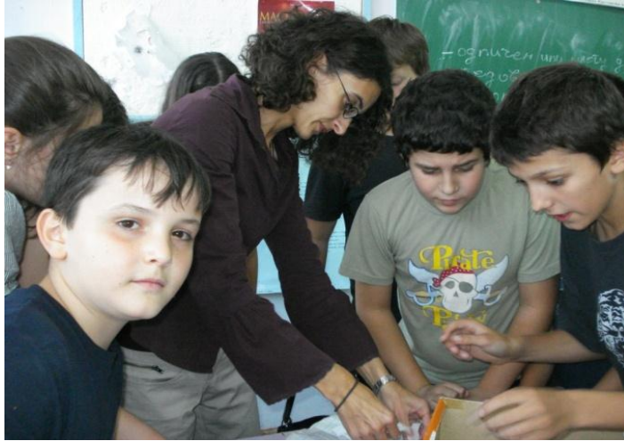
Организирање на изборите за Училишна заедница во ОУ „Живко Брајковски“, Скопје

Во процесите на практикување на демократијата клучно значење добиваат наставниците како насочувачи и објаснувачи на процесите, но и како модели на однесувањето кои треба да овозможат прифаќање на основните вредности на демократските системи од страна на учениците. Имено, постигнувањето на посакуваните резултати од страна на учениците низ процесот на демократско учество и одлучување, ја гради свеста за можностите кои ги пружа овој модел и ја намалува потребата од вонинституционално делување.